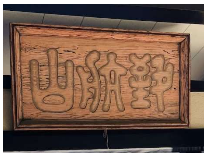
山門の額、到航山は細井光沢による。