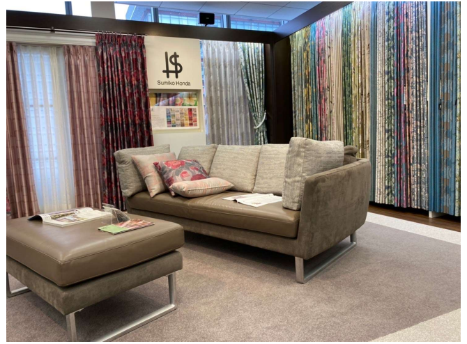
タイルカーペット：インターフェイス