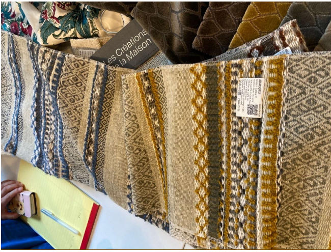
スペイン：レ・クレアン・ド・ラ・マゾン