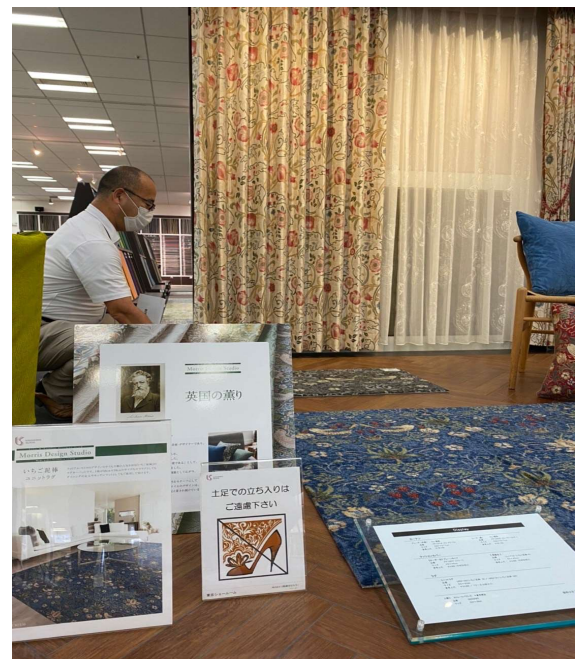
Morris Design Studio