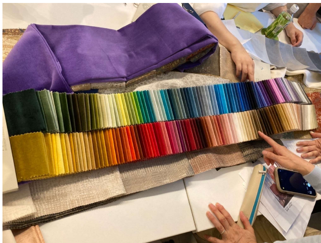
オランダ: ベルベットで有名なレイマーカー社

海外メーカーならではの鮮やかな色使いやデザインの豊富さに、どれを取って見ても新鮮でした。その一つ、スウェーデンのユンバリ社は創業以来、ハンドメイドにこだわった個性的なデザインが魅力的です。スティング・リンドベリのデザインは有名な食器でも見かけた事があり、パネルやクッションカバーにしても引き立ちます。