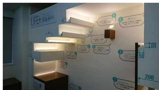
間接照明用器具の紹介コーナー

また、最後には最新の照明カタログ「LIFE」に掲載されている更にコンパクトになった照明器具の紹介もあり、住宅の照明もますます器具を感じさせない、空間を活かす美しい灯りの計画が必要とされていると感じました。